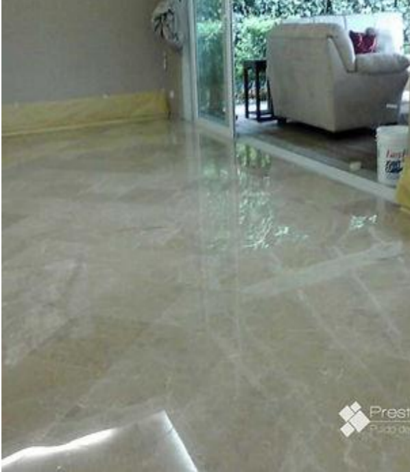
Pulido de Pisos de Mármol