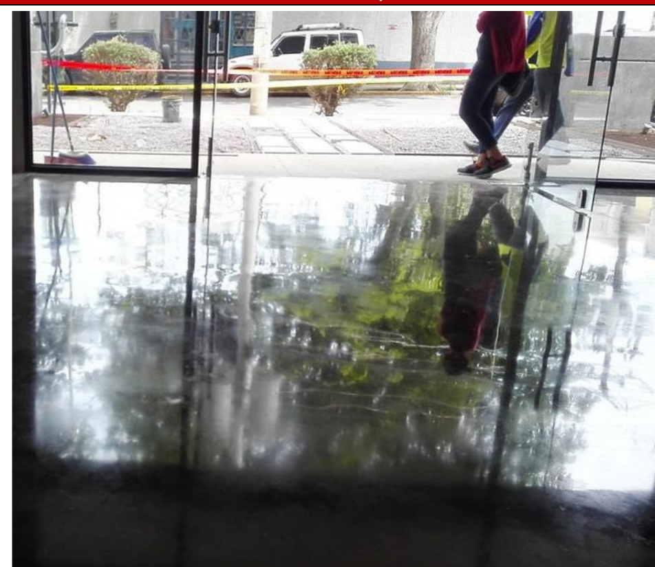
Pulido de Pisos de Concreto, acabado brillante