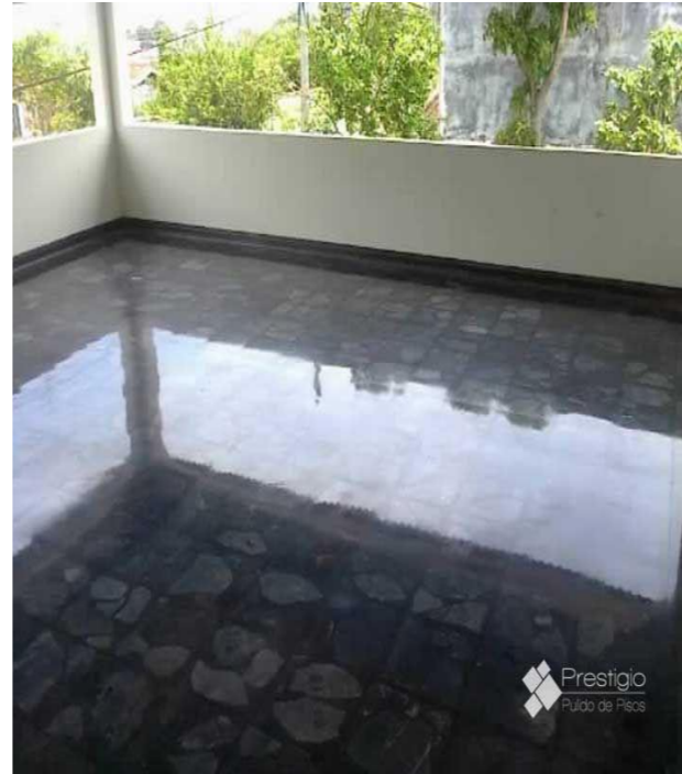
Pulido de Pisos de Paladiana